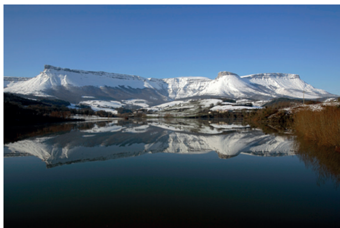
Embalse de Maroño Aiaratur