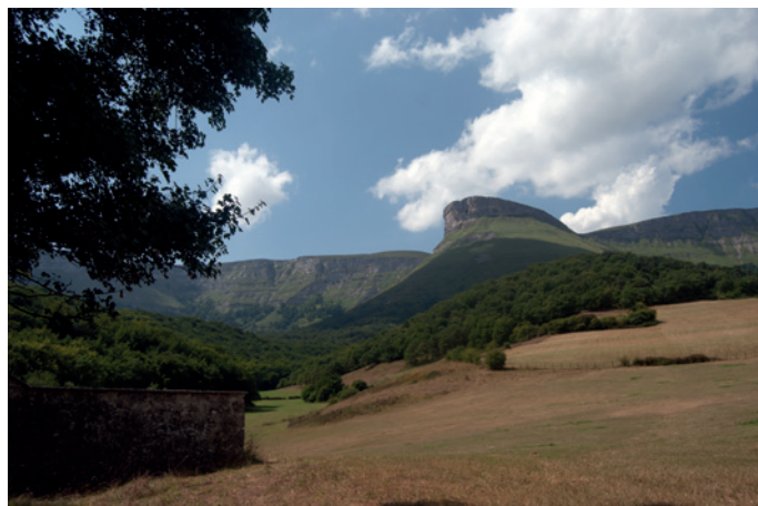
Pico Ungino Geotech, S.L.