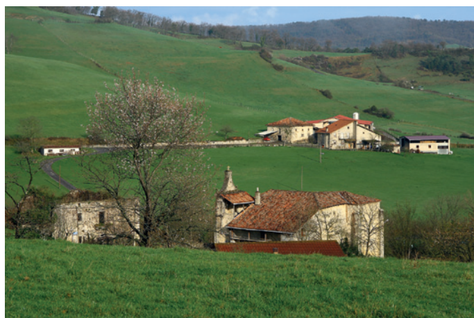
Agiñaga Junta Administrativa Agiñaga